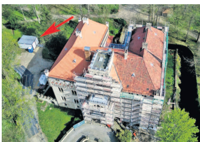
Das Besucherzentrum finden Sie im Container im Schlosspark.

Herzlich Willkommen auf Schloss Seifersdorf sowie dem Besucherzentrum und der Touristeninformation für das Schloss selbst und die gesamte Seifersdorfer Talregion. Während der Sanierungsarbeiten sind wir auf dem Schlossgelände für Sie da. Das Besucherzentrum finden Sie im Container im Schlosspark.