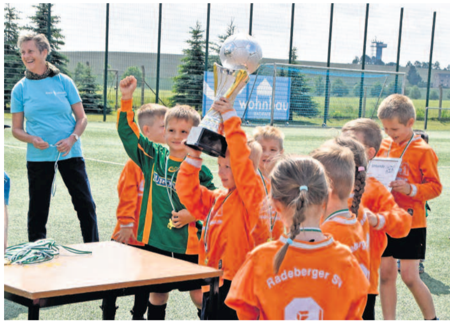
Das Team Max und Moritz Radeberg holte sich den Wanderpokal zurück in die Einrichtung. Im vergangenen Jahr kickte sich das Team aus Ullersdorf auf den ersten Platz.