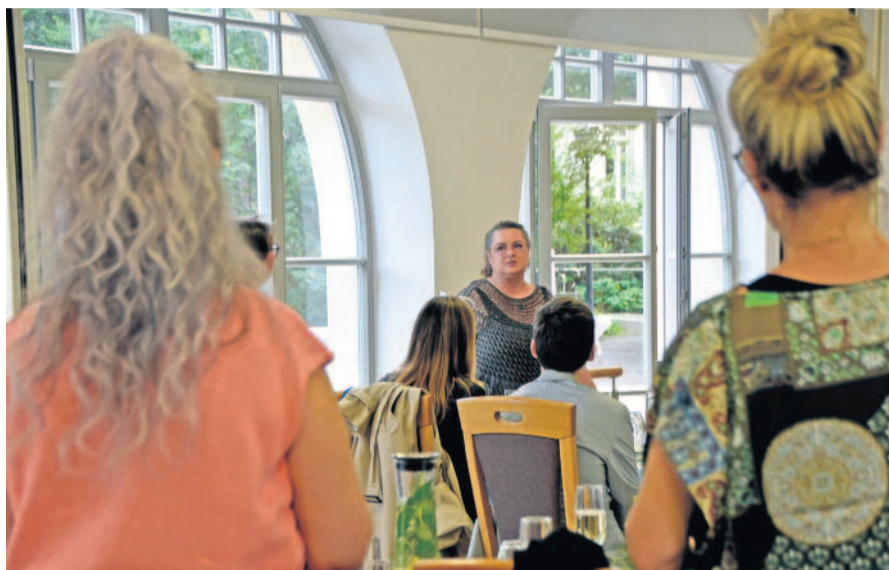
Text & Fotos: Red.