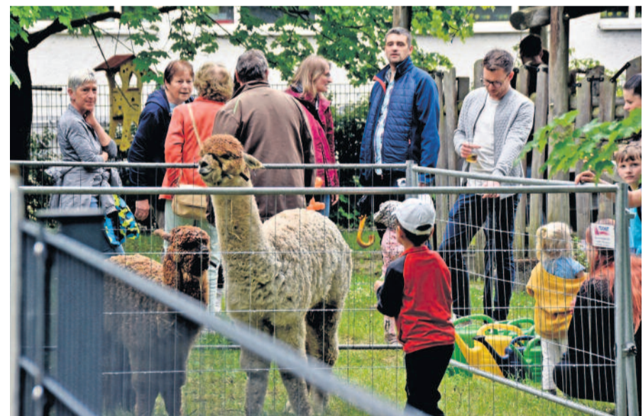
Tierischen Besuch gab es zum Frühlingsfest der Grundschule Süd Anfang Mai. Der bunt gestaltete Nachmittag war der Auftakt eines kleinen Veranstaltungsmarathons.