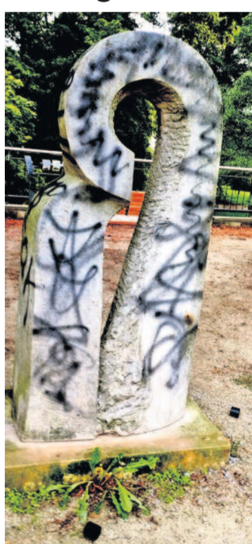
Bereits im vergangenen Jahr beschmierten Unbekannte Stufen, Bänke und Mauern sowie die Traditio-Skulptur im Gelbke Hain.

Es ist wunderschön im Gelbke Hain an der Röder in Radeberg, wenn nicht blinde Zerstörungswut, Lärm und gemeinschaftsschädigendes Verhalten die Idylle stören. So wurden beispielsweise bereits Zaunlatten abgerissen und die Klanginstallation demoliert und beschmiert. Die Liste ließe sich beliebig lange fortsetzen. Während es sich dabei um Vergehen handelt, ist zum Beispiel das Werfen von Müll in die Röder oder das Liegenlassen von Scherben zerschlagener Bierflaschen „lediglich“ eine Ordnungswidrigkeit mit teils jedoch empfindlichen Bußgeldern bis zu 50.000 Euro. Für kleine Kinder, die den Wasserspielplatz im Gelbke Hain auch gerne mal barfuß besuchen, stellt dies jedoch eine große Gefahr dar. Dem Vernehmen nach soll bereits mindestens ein Kind nach dem Rutschen in Scherben gelandet sein.