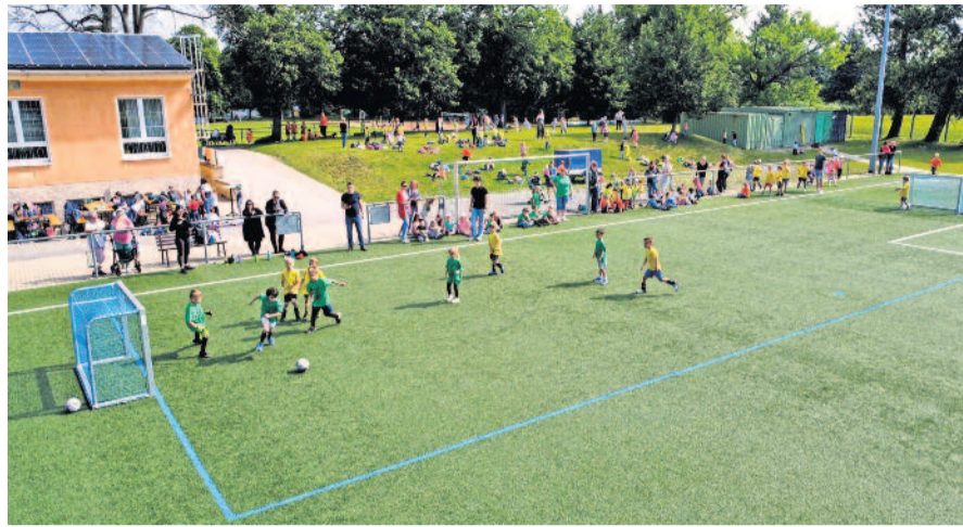
Wie die großen Fußballer kämpften sich die Vorschulkinder durch das Turnier.

Zum Ende des doch sehr kurzen Schul-, aber auch Vorschuljahres lud die Kita Max und Moritz Radeberg wieder zum Radeberger Kita-Cup im Fußballspielen ein. Eigentlich sollte der Anpfiff bereits am 28. Mai 2024 erfolgen, doch Dauerregen machte dem Turnier zunächst einen Strich durch die Rechnung. Am Mittwoch, dem 05.06.2024 fand der Kita-Cup dann statt. Zum Ausweichtermin fanden sich 6 Kindertagesstätten mit ihren Teams im Vorwärtsstadion ein und der Wettkampf konnte beginnen. Nach spannenden Spielen standen die Sieger des Wanderpokales gegen 11.00 Uhr fest: