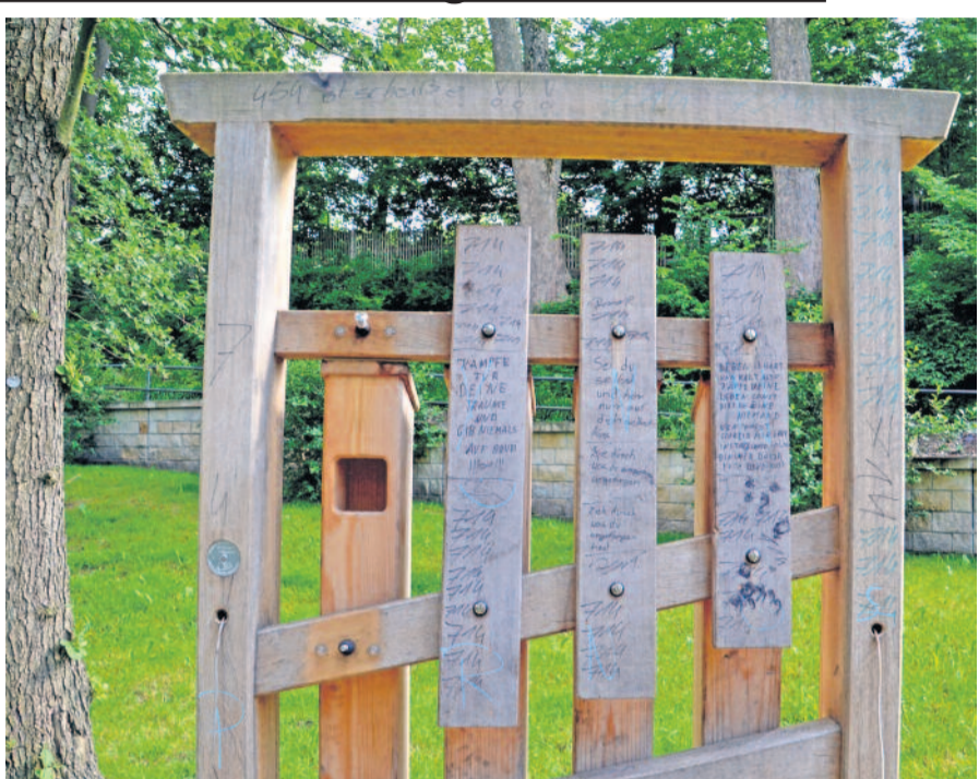
Die Klanginstallation im Gelbke Hain wurde mittlerweile nicht nur beschmiert sondern auch beschädigt. Vor allem für die Kinder ist dieser Vandalismus sehr schade.

Wichtig ist es laut Polizei und Ordnungsamt, den Randalierern das Gefühl der Ungestörtheit zu nehmen. Eine regelmäßige Nutzung der Grünflächen, beispielsweise durch eine Yogagruppe, könne dazu beitragen, die Zerstörer und Verschmutzer von ihrem Tun abzuhalten. Hinsichtlich einer Videoüberwachung liegen die Hürden so hoch, dass diese nicht umgesetzt werden kann. Den Anwohnern raten Polizei und Ordnungsamt daher ein Geräuschprotokoll zu erstellen. Hierzu wird über einen Zeitraum von mindestens zwei Wochen vermerkt, zu welchen Zeiten Lärm aus dem Gelbke Hain zu vernehmen ist. Polizei und Ordnungsamt können ihre Anwesenheit vor Ort dadurch wesentlich gezielter planen und vielleicht jemanden auf frischer Tat ertappen.