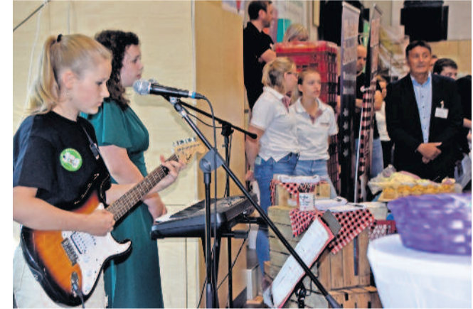
Die Schulband überzeugt mit handgemachter Musik und umrahmt die Eröffnung der Berufemesse.