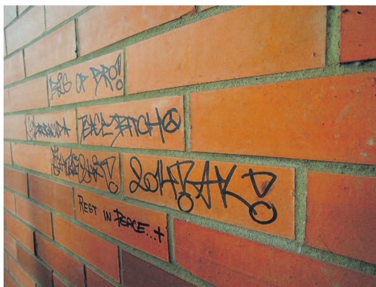
Vandalismus, wie Graffiti, Zerstörung öffentlichen Eigentums oder Aufkleber auf Straßenschildern, Laternen usw. gehören bereits jetzt zu einem großen Ärgernis der Gemeinde Arnsdorf. Lösungsansätze könnte es durch die Allianz Sicherer Kommunen geben.

Die Verwaltung von Arnsdorf hat bereits positive Erfahrungen mit der Initiative gemacht und fühlt sich gut beraten und betreut. In der Sitzung wurde deutlich, dass die Mehrheit des Gemeinderats die Kooperation befürwortet. Trotz eines kritischen Einwands eines Gemeinderatsmitglieds, das die Aktion als „Labberkreis“ bezeichnete und als überflüssig einstufte, sprachen sich mehrere Ratsmitglieder aus eigenen Erfahrungen für das Projekt aus. Dies führte dazu, dass das Gremium letztendlich mit 15 Ja-Stimmen und nur einer Neinstimme den Beitritt zur ASSKOMM positiv beschied.