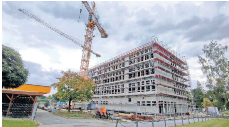
Die neue Oberschule in Arnsdorf nimmt Gestalt an. Ab dem Schuljahr 2026/2027 sollen die ersten Schülerinnen und Schüler am Standort unterrichtet werden. Auch für die Sicherheit im Bereich Bildung soll künftig die Arbeit mit der ASS-KOMM präventiv wirken.

Die Entscheidung kommt zu einem Zeitpunkt, an dem Arnsdorf durch den Bau der neuen Oberschule mit einer Zunahme von Kindern und Jugendlichen im Ortsgeschehen rechnet. Diese Entwicklung bringt sowohl Chancen als auch Herausforderungen mit sich. Um potenziellen Problemen wie Verkehrssicherheit, eventueller Drogenmissbrauch, Gewalt oder Vandalismus frühzeitig entgegenzuwirken, setzt die Initiative ASSKOMM auf Vernetzung und präventive Maßnahmen. Ziel ist es, durch spezielle Förderangebote und eine enge Zusammenarbeit zwischen den Kommunen eine sichere Umgebung für alle Bürgerinnen und Bürger zu schaffen.