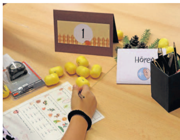
Text & Fotos: Heideschule Radeberg

Bei strahlendem Sonnenschein öffnete die Heideschule auf der Ferdinand-Freiligrath-Straße 27 in Radeberg für viele neugierige Besucher am 20.09.2024 ihre Türen. Es wurde geschminkt, gebastelt, gegrillt, gesungen, gegraben, gerätselt, gewerkelt, gesprungen, experimentiert, duelliert, gelernt und noch so viel mehr. Etliche ehemalige Schülerinnen und Schüler waren beim Speed Dating dabei. Mit Kaffee, selbst gebackenem Kuchen oder von den Mädchen und Jungen hergestellter Nudel- und Kartoffelsalat wurde für das leibliche Wohl gesorgt. Die Schülerinnen und Schüler haben in den Tagen vor dem Schulfest das Schulhaus sowie das Außengelände liebevoll auf Vordermann gebracht und gestaltet. Und zum Fest führten sie durch die Stationen oder verkauften Speisen und Getränke. Dank der vielen fleißigen Helferinnen und Helfer war es ein rundum gelungener Nachmittag.