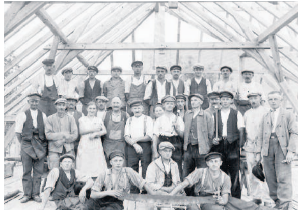
Ende August 1928 wurde Richtfest gefeiert, sodass noch im Oktober im Saal die Kirmes mit einem großen Fest begangen werden konnte.

Die Geschichte des Volksheims beginnt am 07. August 1927, als der „Freie Turn- und Sportbund“ das Baufeld erwirbt. Noch im selben Jahr erfolgt die Grundsteinlegung, gefolgt vom Richtfest im Sommer 1928. Am 01. und 02. Juni 1929 wird das Gebäude feierlich eingeweiht. Die Finanzierung war damals eine große Herausforderung; sie wurde durch den Verkauf von Anteilsscheinen, Spenden und Einnahmen aus Kulturveranstaltungen sichergestellt. Besonders hervorzuheben ist die unentgeltliche Arbeit von 132 engagierten Bürgern, die maßgeblich zum Bau des Volksheims beitrugen.