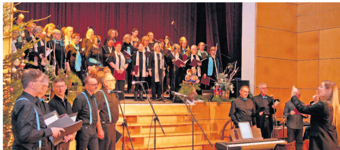
Jüngst begeisterten beide Chöre bei ihrem Weihnachtskonzert im Bürgerhaus.