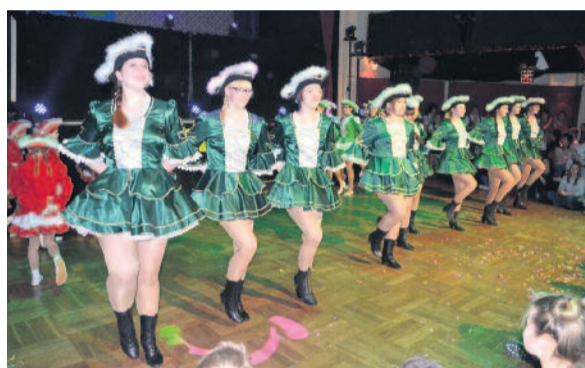
Fasching mit dem LCC (Lomnitzer Carnevalsclub) im großen Saal.