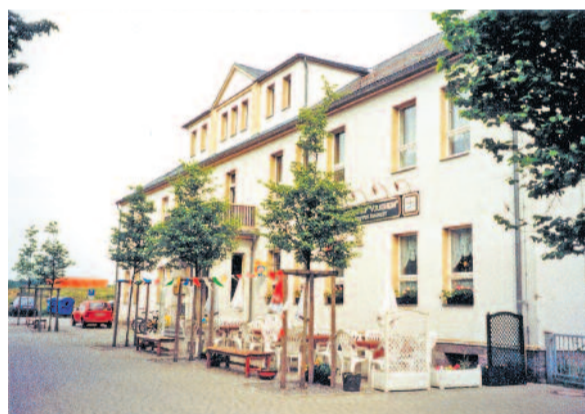
Außenaufnahme des Volksheims mit Biergarten Anfang der 1990er Jahre.

Mit der politischen Wende in den späten 1980er Jahren kam frischer Wind ins Volksheim: Baufirmen sorgten für weitere Modernisierungen und Erweiterungen des Gebäudes.