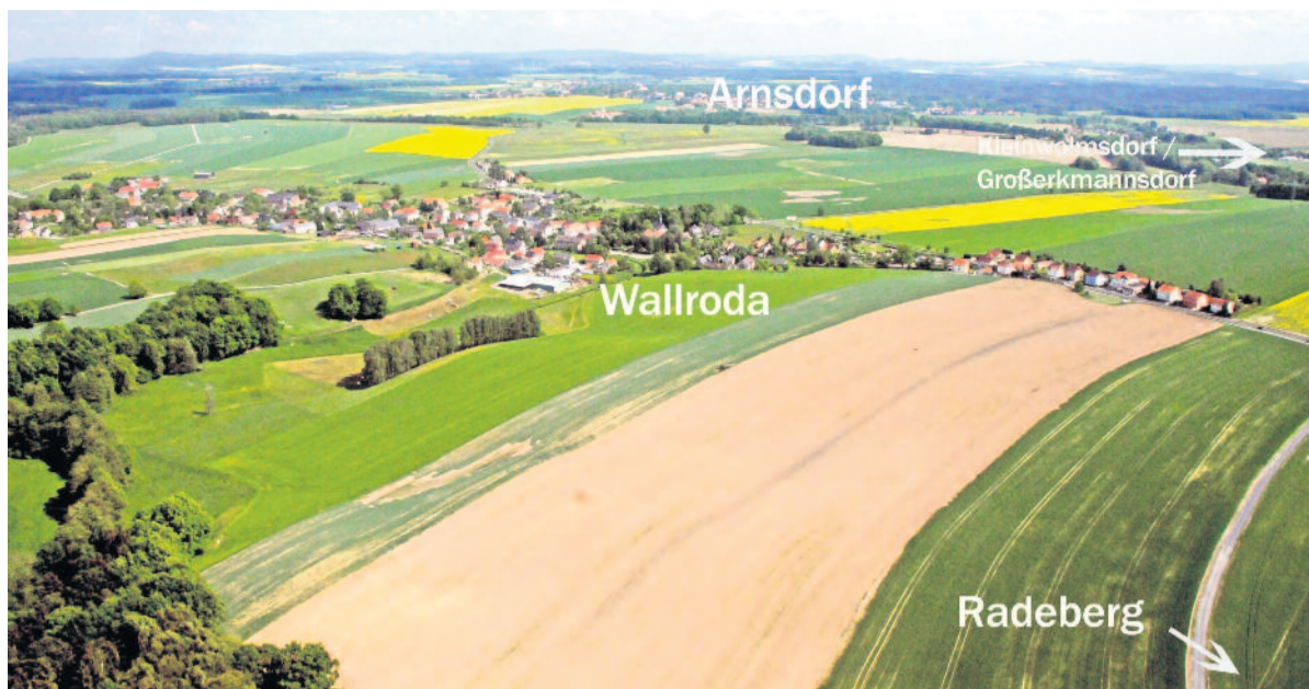
Zwischen Radeberg, Wallroda, Kleinwolmsdorf und Großkammansdorf wurden zwei Flächen vorgeschlagen, welche teilweise für potenzielle Gewerbeflächen erschlossen werden könnten. Mittels Bürgerentscheid in beiden Kommunen wurde nun entschieden, ob die Pläne weiterverfolgt werden sollen.

„Im Ergebnis wird eine Brücke in einem zweckmäßigen und verkehrssicheren Zustand entstehen, die den Anforderungen unserer und zukünftiger Zeiten entspricht“, so Björn Schober abschließend.