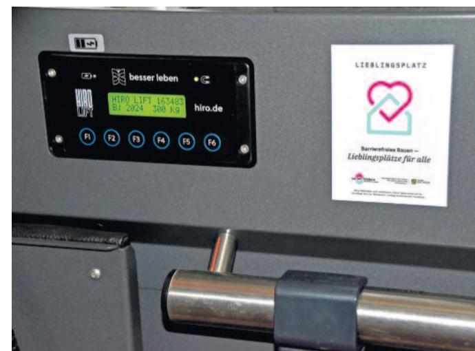
Finanziert wurde die Anschaffung des Liftes über das Förderprojekt „Lieblingsplätze“ des Landkreises Bautzen.

Das Volksheim dient nicht nur als Veranstaltungsort für den Carnevalsclub, sondern auch als Begegnungsstätte für die gesamte Gemeinde. Hier finden regelmäßig Kulturveranstaltungen des Heimatvereins Lomnitz e. V., Schuleingänge, Einwohnerversammlungen sowie Wahlen statt. Der große Saal bietet Platz für über 300 Personen und ist damit ein zentraler Ort des gesellschaftlichen Lebens in Lomnitz.