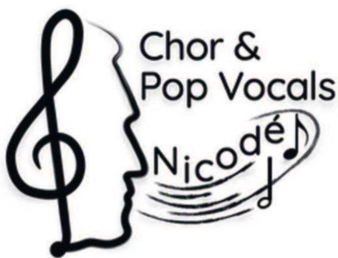
Der Kopf, wie hier im bisherigen Logo, ist auch wieder der zentrale Bestandteil.