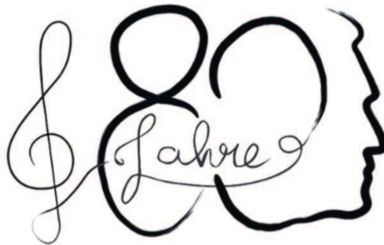
Das Logo im Jubiläumsjahr 2025.