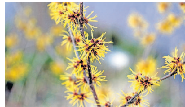
Die Blüte der Hamamelis japonica – Japanische Zaubernuss.